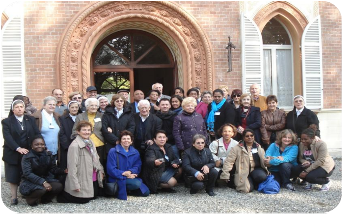
LMS e Suore MSCS partecipanti all'Assemblea