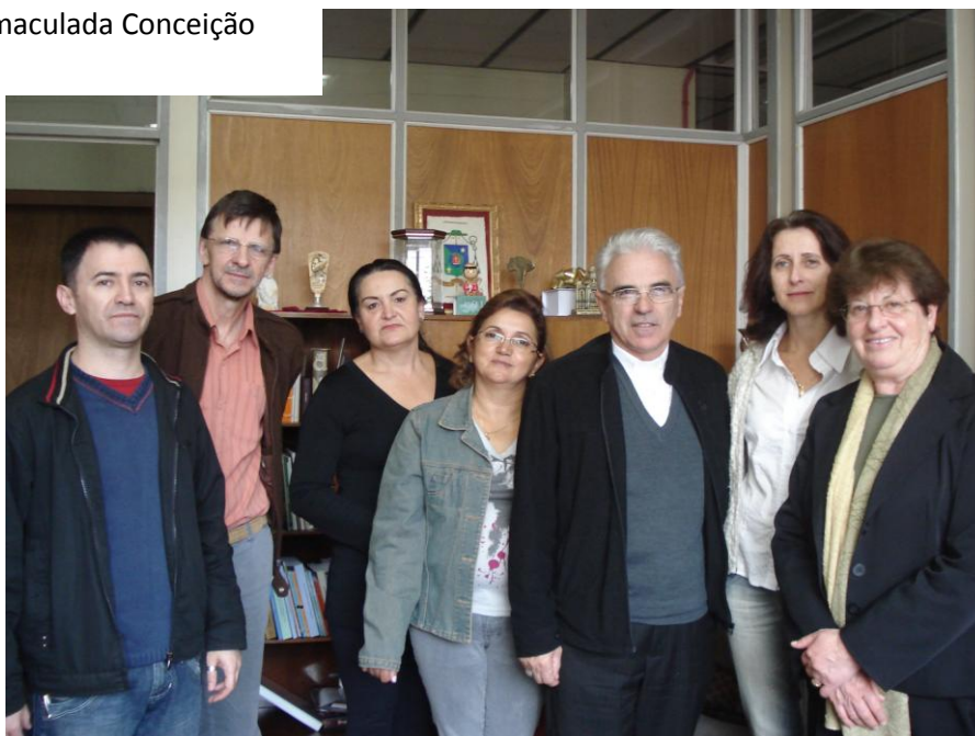
GIC AUDIÊNCIA COM O NOVO BISPO DE CAXIAS DO SUL RS