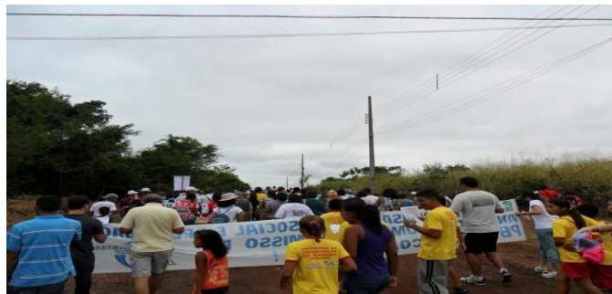
17º Grito do Excluídos: Pela Vida Grita a Terra... Por Direitos, Todos Nós.