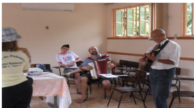
Formação Centro Pastoral Para Migrantes