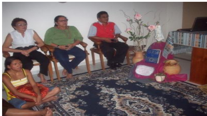
Encontros de Formação nos Núcleos.