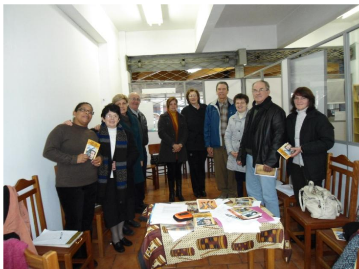
Grupo Gristo Rei na Missão Scalabriniana em Porto Alegre